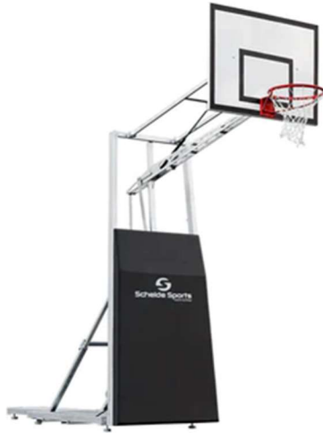
3x3 Street Slammers

Er worden twee soorten baskets van het merk Schelde Sports geleverd, één 3x3 SAM voor het hoofdveld en de 3x3 Street Slammers voor de overige basketbalvelden