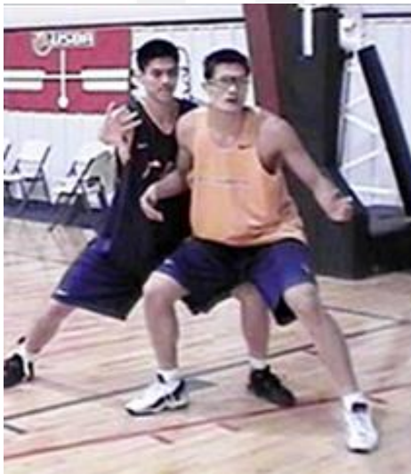
In de rug

Er zijn verschillende manieren van verdedigen: